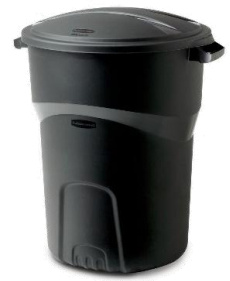
Plástico máximo de 35 galones