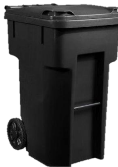
Plástico de 36 galones o más con ruedas