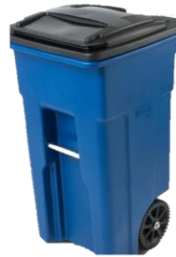
Plástico máximo de 35 galones con ruedas